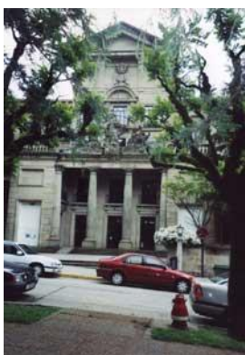
Museu Luís Iglesias. Santiago

Por cartas enviadas a U. de Compostela sabemos que a finais do 1817 está de novo en París onde merca instrumental científico para esa Universidade e imparte un cursiño de Astronomía no Ateneo das Ciencias de París. Despois pasa a Italia para facer traballos sobre mineraloxía.